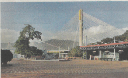
圖中一次非禮地點是青嶼幹線觀景台辭職處。

幹線觀景台非禮姐姐X，另於2016年至去年3月八次非禮妹妹Y，其中五次是坐將車停在明愛醫院外發生，另一次在長沙灣瓊林街，餘下一次發生於巴士上。姊妹去年暑假報警，被告去年7月辭去教職。